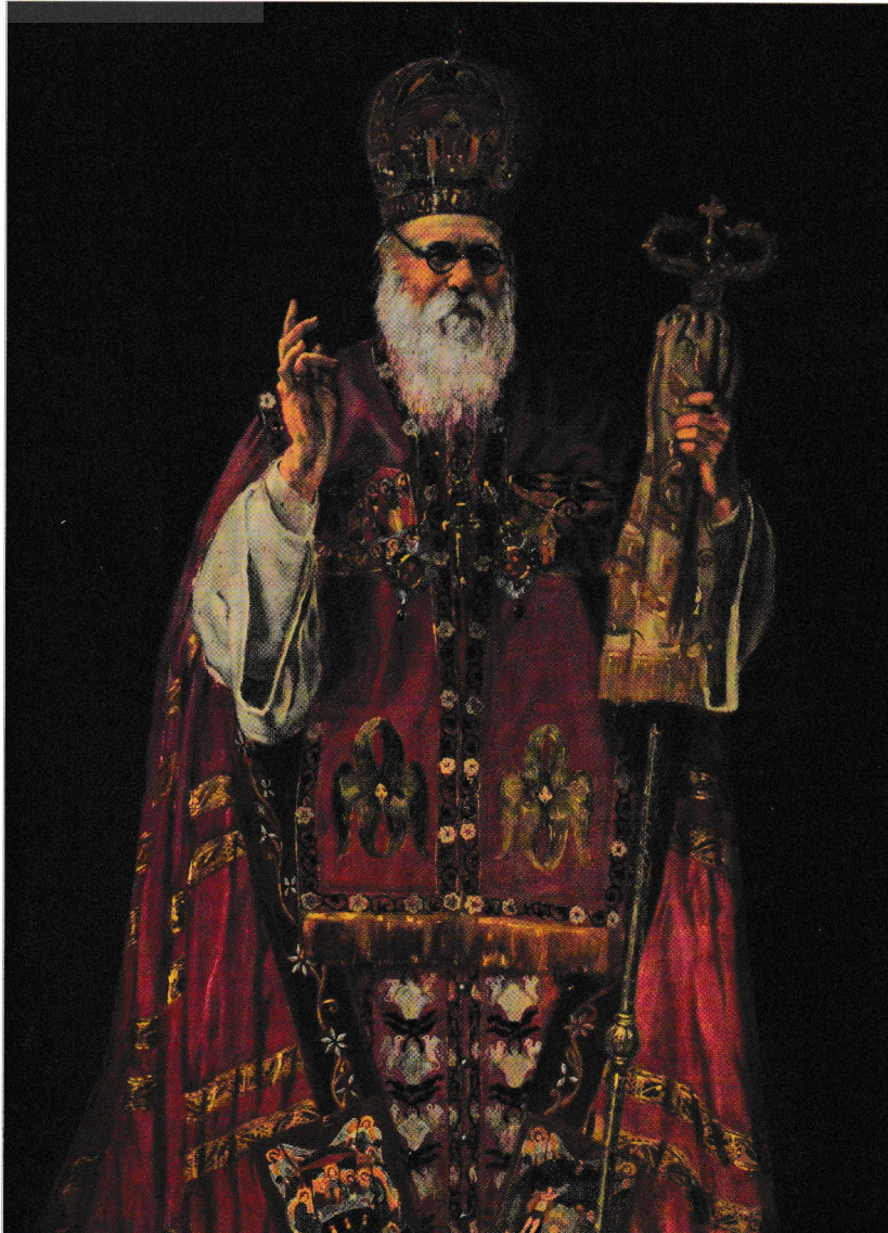
Patriarhul Nicodim Munteanu

Patriarhul Nicodim este unul dintre traducătorii Bibliei românești (ediția 1936, alături de preoții profesori Gala Galaction și Vasile Radu). Este autorul multor lucrări teologice, de zidire sufletească, cuvântări, pastorale, cărți de rugăciuni ș.a. între care pot fi menționate: Ce să crezi și cum să trăiești? Adecă schema credinței și moralei creștine , București, 1905; Cuvântări liturgice , București, 1906; Călăuza creștinului la biserică sau cum se cuvine să stea creștinul în biserica la slujba Sf. Liturghii , București, Neamț, 1907; Ortodoxia și creștinismul apusean. Prelucrare după A. P. Lopuhin și alții , București, 1912; Cuvântări liturgice. Dumnezeu și dreptatea lui. Mâna lui