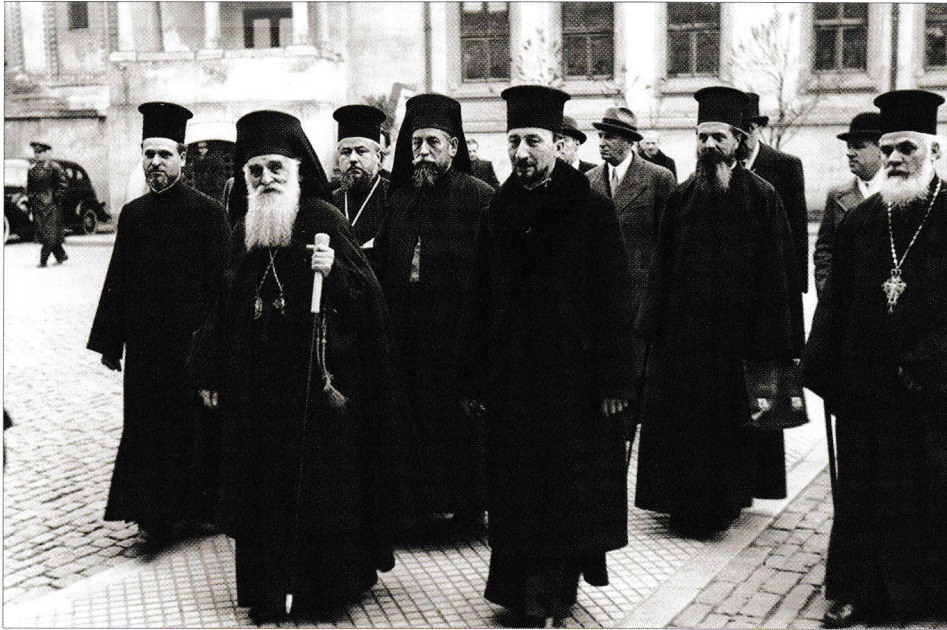
Patriarhul Miron Cristea însoțit de ierarhi, arhimandriți și demnitari