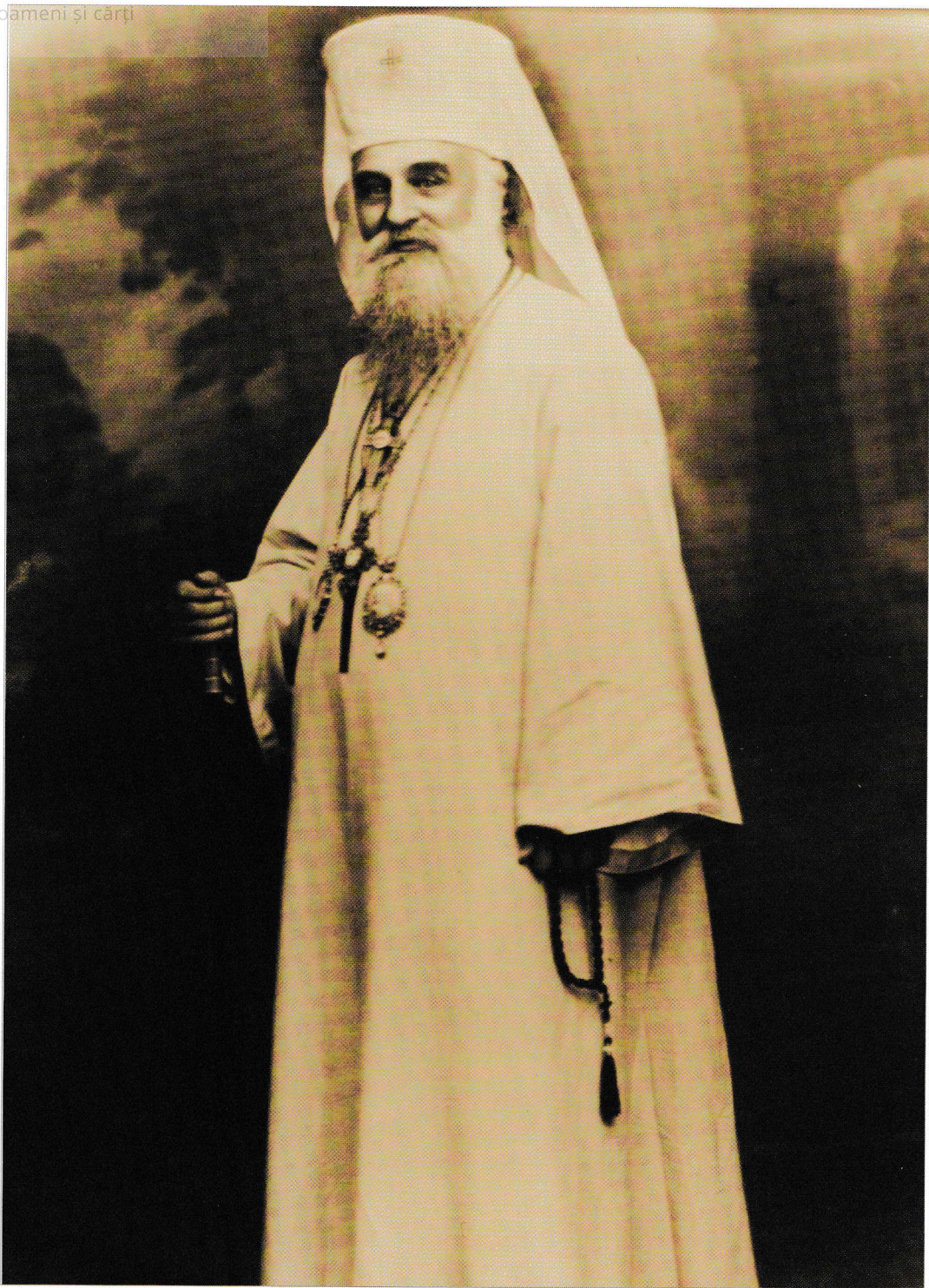
Patriarhul Miron Cristea