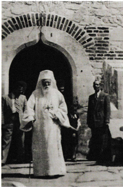
Patriarhul Nicodim la Mănăstirea Neamț

Dumnezeu în lumea văzută. Scurtă explicare a Sfintei Liturghii și pomenirea morților. Originale și prelucrări, Neamț, 1933; Cuvântări, pastorale și îndemnuri, Neamț, 1940.