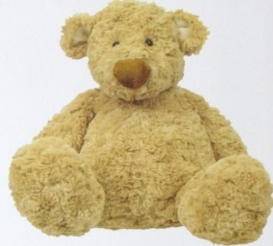
ursuleț de pluș