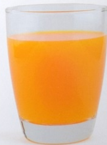
suc de portocale