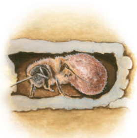
Albina iese din cocon.