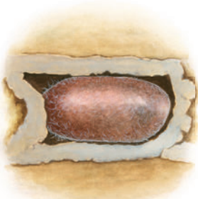
În cocon, larva se transformă în albină.