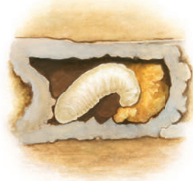
Larva se hrănește cu polen.