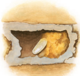
Oul este depus în cuib.

După două-trei zile, din ou iese o larvă. Aceasta se hrănește cu polenul adunat de albină și se dezvoltă. Când larva ajunge suficient de mare, ea se transformă în pupă și se închide într-un cocon. În acest cocon, în timpul iernii, pupa își schimbă forma. Astfel, în primăvara următoare, din cocon va ieși o albină sălbatică adultă.