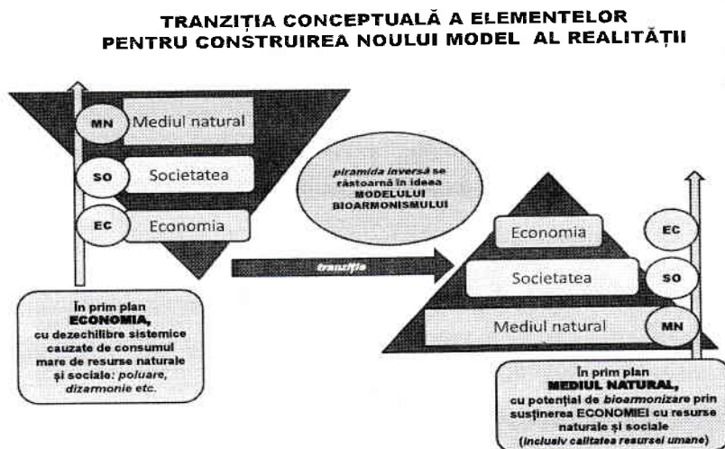
Fig. 9 - Aplicarea treptată a principiilor Teoriei Bioarmoniste la Realitatea percepută , cu tranziția spre modelele cu potențial de bioarmonizare la toate nivelurile societale și economice, având ca referință viul planetar și mediul natural în ansamblul său

Ideologia bioarmonistă pune în acord părțile cu întregul în ideea înțelegerii lumii (ca parte și ca întreg) în raport cu modelul complex al Naturii, având ca reper esențial Viul („bio”) și Viața cu conexiunile și modelele economice și socio-culturale contemporane. Pentru a înțelege procesele de bioarmonizare devine obligatorie o nouă abordare a realității, respectiv prin inversarea piramidei actuale spre o ordine „optimizată” ce poate induce mecanisme de sustenabilitate pe principii de echilibru dinamic și de armonizare (fig. 9).