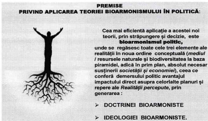
Fig. 10 - Necesitatea generării doctrinei și ideologiei bioarmoniste

Vorbim în esență despre o nouă abordare a realității și o mai profundă înțelegere a vieții, adică despre o regenerare politică în lumea în care trăim.