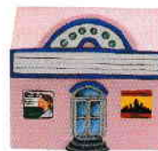
le cinéma cinematograful