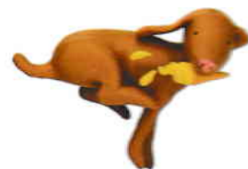
le chien câinele