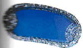
la piscine piscina