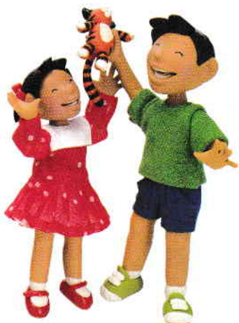
la sœur sora le frère fratele