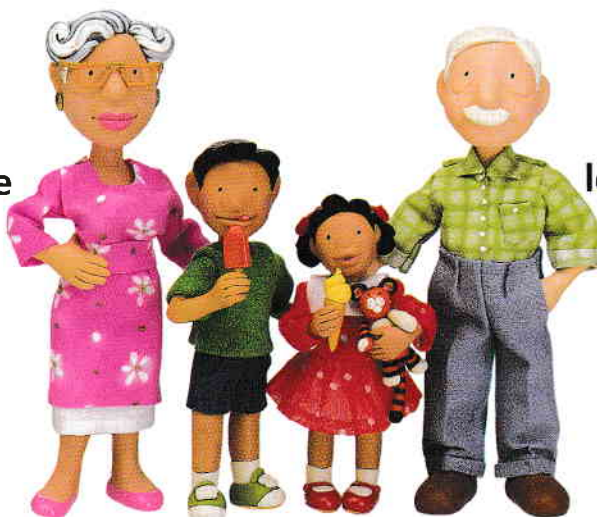
le petit-fils nepotul