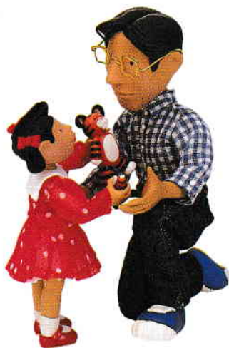
la fille fiica le père tatăl