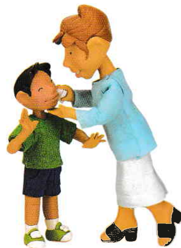
le fils fiul la mère mama