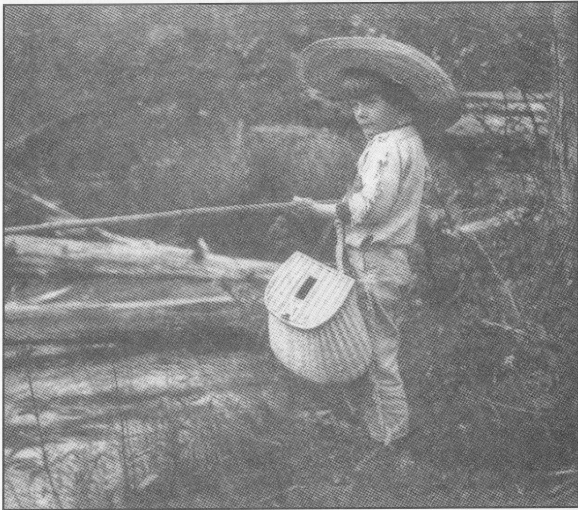
Hemingway la pescuit de păstrăv pe pâraul Horton. Iulie 1904.