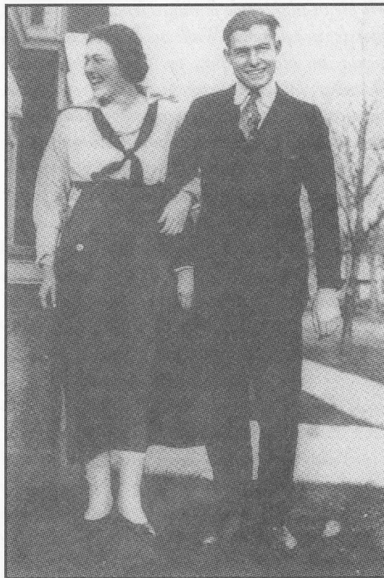
COLECȚIA HEMINGWAY, BIBLIOTECA JOHN F. KENNEDY