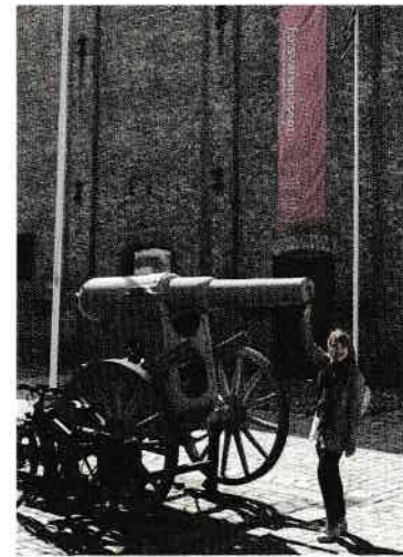
Muzeul Forțelor Armate - locul ideal pentru o ședință foto pe timp de pace!