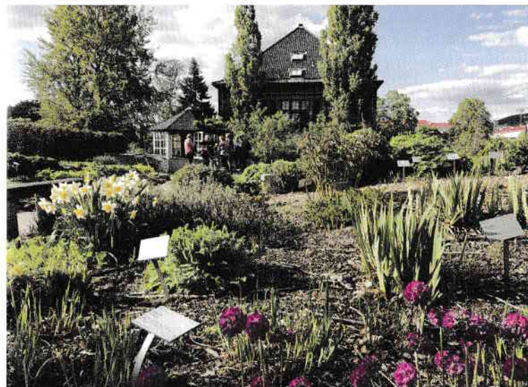
Grădina Botanică din cartierul Tøyen se caracterizează printr-o diversitate uluitoare!