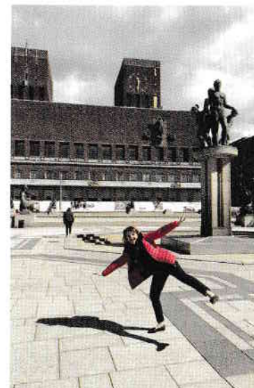
Primăria ( Rådhus ) și statuia celor două lebede, devenită punct de întâlnire pentru turiști și nu numai.