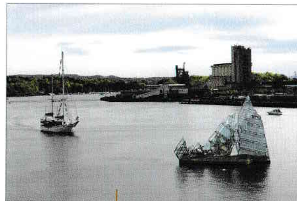
Vestita statuie She Lies a Monicăi Benvicini, plămădită din panouri de oțel și sticlă.