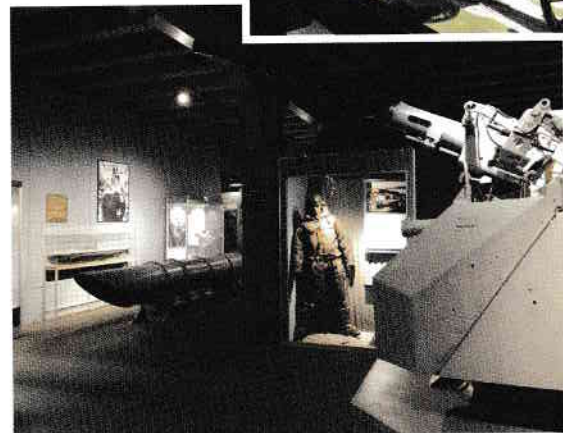
Reconstituirile „la scară” ale scenelor de luptă fac deliciul vizitatorilor.