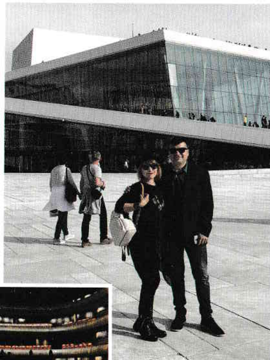
Cu tenorul Gabriel Birjovanu de la Opera Națională norvegiană, într-o spectaculoasă vizită la... locul său de muncă.