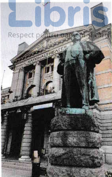
Teatrul Național - prima sa reprezentatie a avut loc pe 1 septembrie 1899.