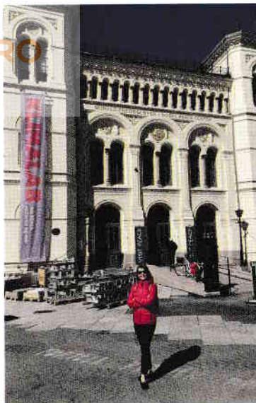
Nobels Fredssenter, Centrul Premiului Nobel pentru Pace din Oslo.