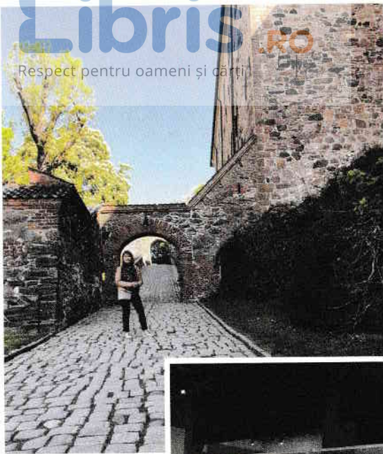
Muzeul norvegian al Forțelor Armate, situat în zona Fortăreței Akershus.