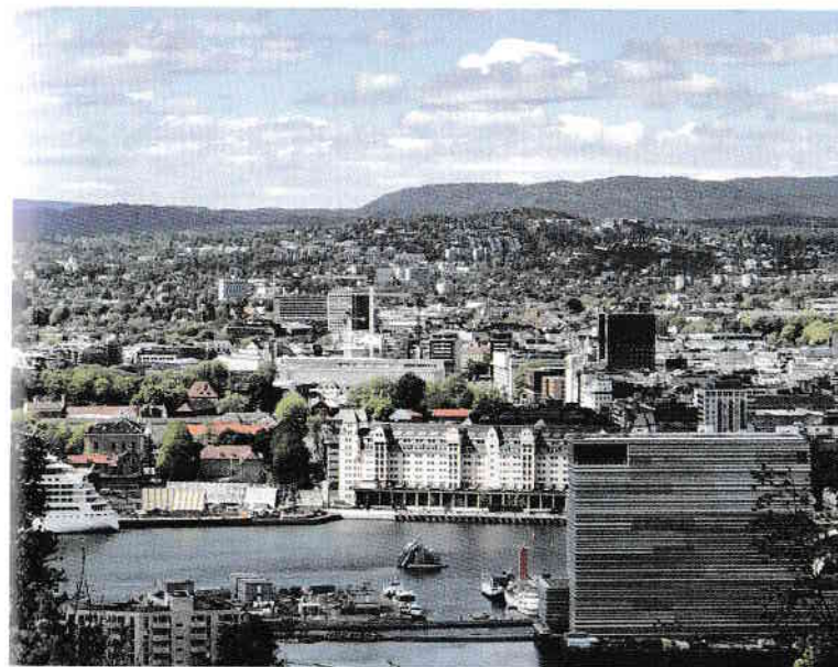
Oslo, vedere de sus, de pe „meterezele” Parcului Ekeberg.