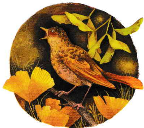
Festivalul Frunzelor pg. 24