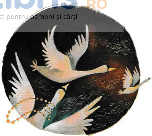
Despărțirea pg. 48