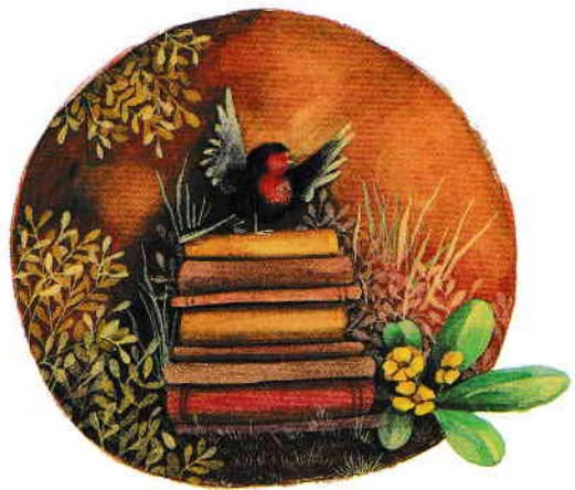
Duelul pg. 58