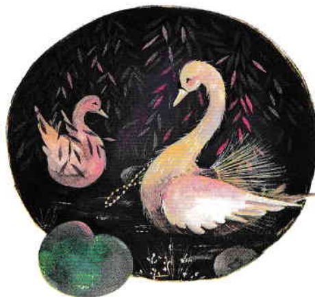
O veste minunată pg. 16