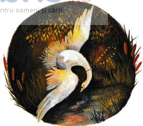
Pădurea Cântătoare Un spectacol pe cinste pg. 6