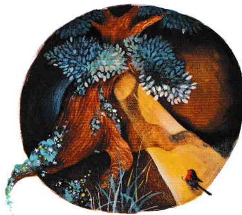
Lumina din scorbură pg. 36