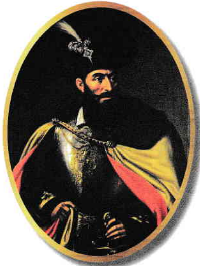
Mihai Viteazul (1558-1601)

1.3. REȚEAUA PERSONAJELOR! Identifică în text și scrie cuvinte și expresii care îl caracterizează pe Mihai Viteazul sau faptele lui, în casetele date.