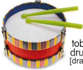
tobă drum [dram]