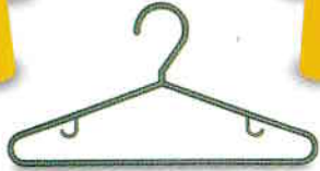
umeraș coat hanger [cɔʊt heŋgər]