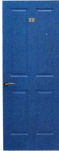
ușă - door [dɔr]