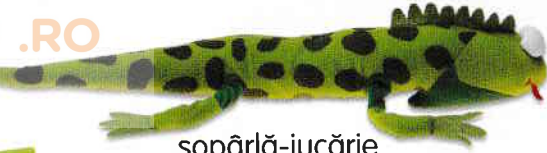
șopărlă-jucărie toy lizard [toi lizăd]