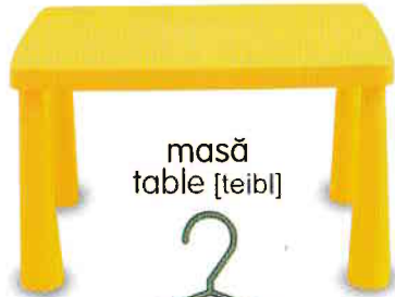
masă table [teibl]