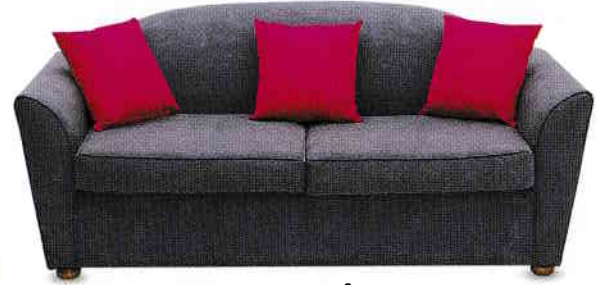
canapea - sofa [səʊfə]