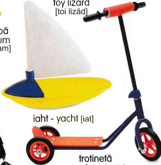
iaht - yacht [iaț]