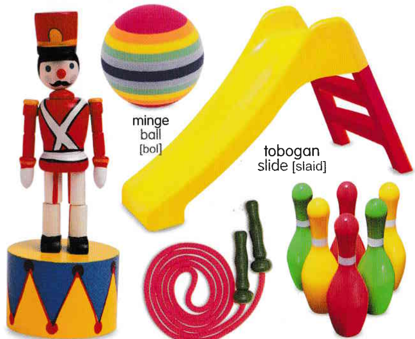
minge ball [bol]