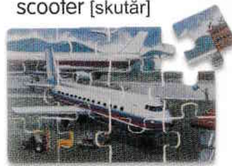
puzzle jigsaw [djiġso]