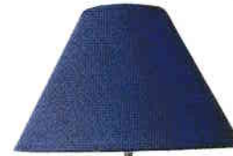
veioză lamp [lemp]