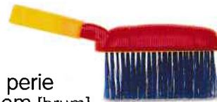
perie broom [brʊm]