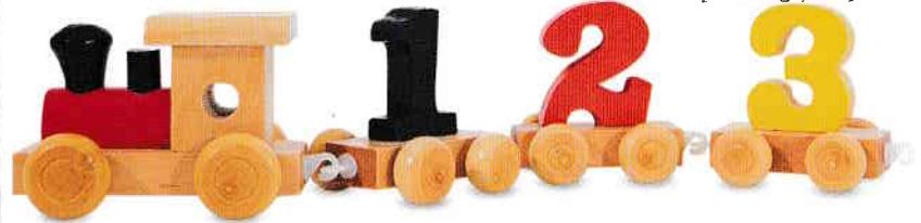
trenuleț - train [trein]