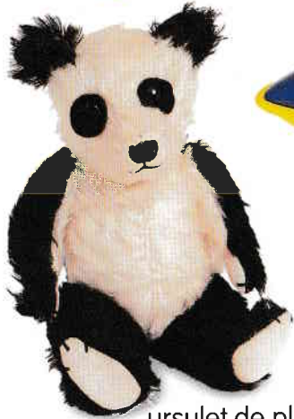
ursuleț de pluș teddy bear [tedi bear]