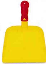
fărăș dustpan [dastpen]