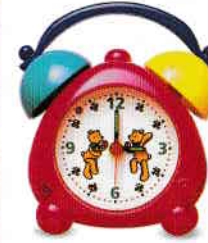
ceas - clock [klok]