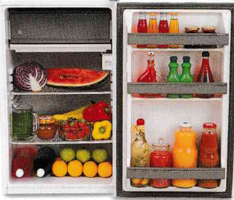
frigider - fridge [frɪdʒ]