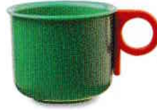
cană - cup [kəp]