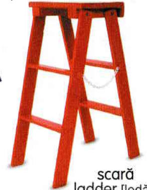
scară ladder [ledər]