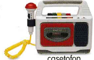
casetofon tape recorder [teɪp rɪkɔdər]