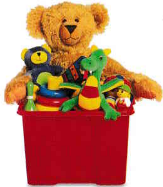
cutie pentru jucării toy box [toi bɔks]