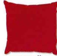
pernă pillow [pɪləʊ]