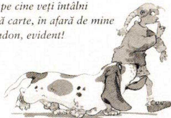
Nelly Rapp și London

Pst! Iată pe cine veți întâlni în această carte, în afară de mine și de London, evident!