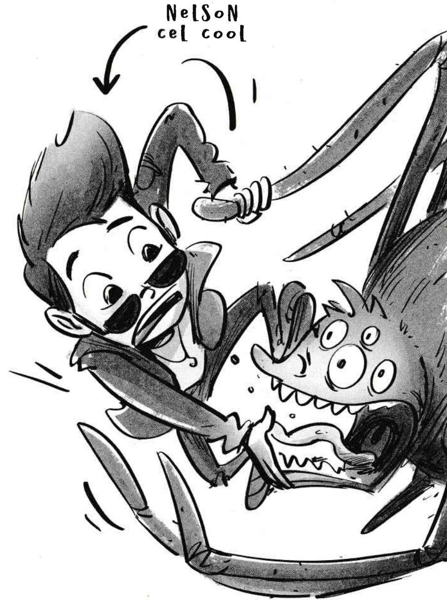
NELSON cel cool