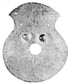
Idolul antropomorf de la Moigrad (Mileniul IV î.Hr.)

Dacă vor fi de folos și unui singur om atunci această cărțuie este justificată, nu a fost o bătaie cu degetul în ușa zădărnicii.