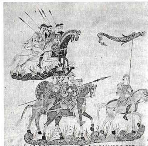
Fig. 1: Detaliu din tapiseria de la Bayeux, cu drapelul normand asemănător steagului dacic (balaur cu capul de lup), 1066.

În materie de cunoaștere, pentru a nu greși, nu trebuie să rămânem la suprafața lucrurilor, trebuie să căutăm să știm și să înțelegem ce fenomene din adâncimea realității au dus la aspectele de suprafață a realității.