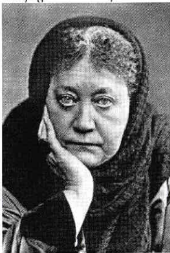
H.P. Blavatsky în 1889

Mai târziu, la mijlocul primului mileniu D.C., Pseudo-Dionisie Areopagitul îl folosește în Theologia Mystica .