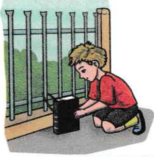
A lega cartea de gard.