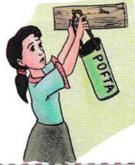
Și-a pus pofta-n cui!