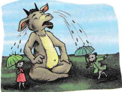
A da apă la soareci.