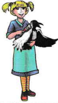
A umbra cu ciara vopsită.