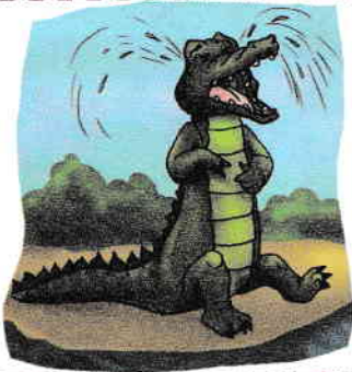
Plange cu lacrimi de crocodil.