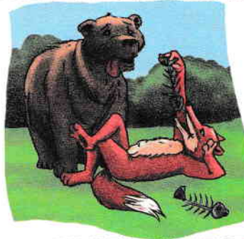
A-i lăsa gura apă.