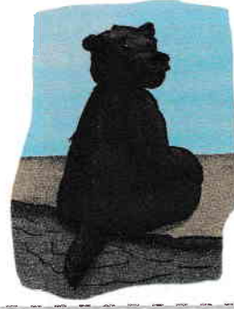
A intrat la apă.