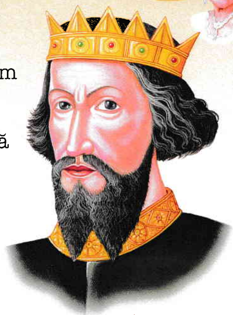
▲ Regele Wilhelm

Odată cu începutul domniei regelui Wilhelm în 1066, o nouă dinastie a înlocuit clasa aristocratică existentă cu proprietarii de pământuri normanzi. Cucerirea normandă a Angliei a marcat sfârșitul dominației anglo-saxone, iar englezii au intrat sub influența normanzilor. Regele Wilhelm a adus cu el sistemul feudal și schimbări în biserici și mănăstiri. Limba engleză, cultura și arhitectura au evoluat și s-au dezvoltat.