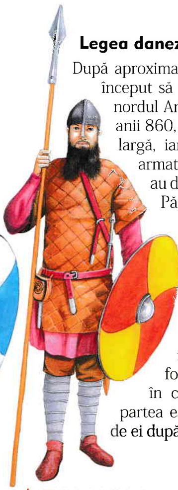
▲ Războinici vikingi

După aproximativ 840 d.Hr., danezii au început să se stabilească în estul și nordul Angliei și nordul Scoției. În anii 860, danezii invadau pe scară largă, iar în 865 au sosit cu o armată enormă. Anglo-saxonii au descris-o ca Marea Armată Păgână. Danezii s-au stabilit pe pământul britanic și au devenit fermieri, negustori și războinici. Până la sfârșitul secolului al nouălea, ei au cucerit Anglia, dar în 878 au fost învinși de regele Alfred. Un tratat a fost semnat între aceștia în care danezilor li s-a dat partea estică a Angliei, stăpânită de ei după Legea daneză.