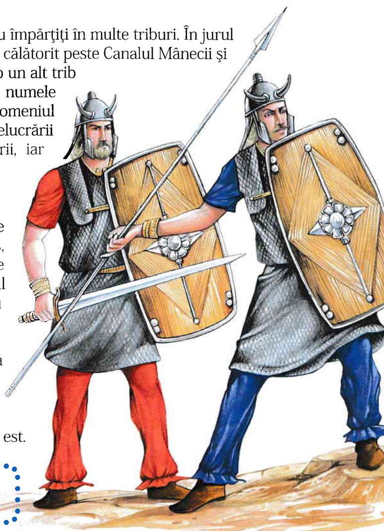
▲ Luptători celți

Numiți împăratul roman care a condus invazia reușită a provinciei Britannia.