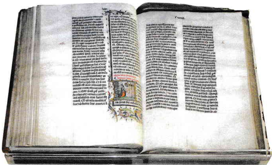
▲ Sfânta Biblie

Luca, autorul celei de-a treia Evanghelii, a scris și Faptele Apostolilor. Cartea descrie fondarea religiei timpurii și răspândirea creștinismului. Din această carte ajungem să aflăm despre viețile Sf. Petru (conducătorul apostolilor) și Sf. Pavel (urmașul lui Hristos). Cartea se încheie cu execuția Sf. Pavel la Roma.