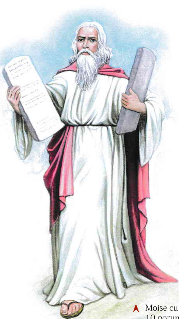
▲ Moise cu cele 10 porunci

Druidismul era religia celților. Celții erau triburi răspândite în Asia Mică, Galia, Irlanda și în alte părți ale Europei. După ce aceștia au ocupat Marea Britanie, druidismul s-a răspândit foarte mult și a influențat practicile spirituale religioase din acele locuri. Preoții și preteșele se numeau druzi și erau cei care predicau această religie. Druidismul era o religie politeistă. Druzii venerau păduri, copaci, ape, munți, precum și insule sacre.