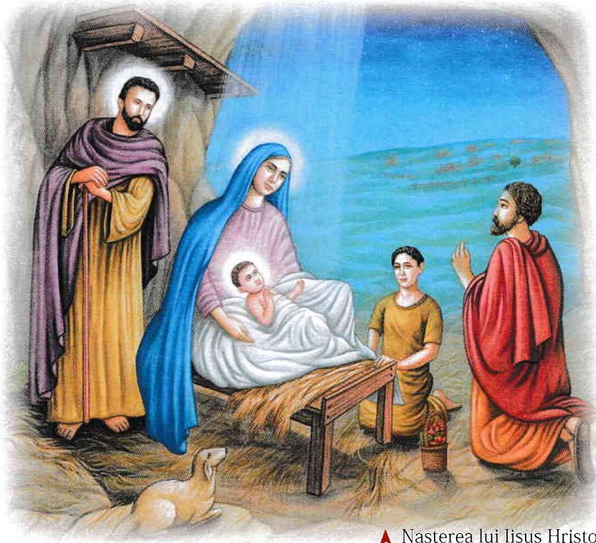
▲ Nașterea lui Iisus Hristos

Iisus Hristos a fost fondatorul creștinismului. Toate informațiile despre viața lui provin din cele patru Evanghelii din Noul Testament (Biblia). Evangheliile după Matei și Luca declară că Iisus s-a născut în familia lui Iosif și a Mariei în Betleem, un mic oraș din Israel, aflat în apropierea Ierusalimului. El a crescut în orașul Nazaret din Galileea, unde și-a ales cei doisprezece apostoli (discipoli) pentru a-și răspândi învățăturile în lume.