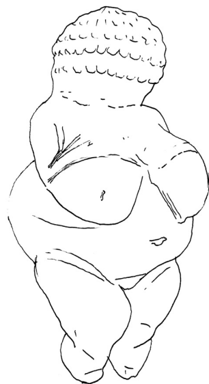
Desen al uneia dintre cele mai vechi figurine din Paleolitic descoperite pe teritoriul Europei (la Willendorf, în Austria Inferioară). Nu s-a putut stabili dacă statueta din calcar oolitic, datată 28 000–25 000 î. Hr., servea drept idol al fertilității sau drept obiect erotic.

Am spus despre factorii reali că sunt recurenți, fiindcă formele pe care poate să le îmbrace organizarea