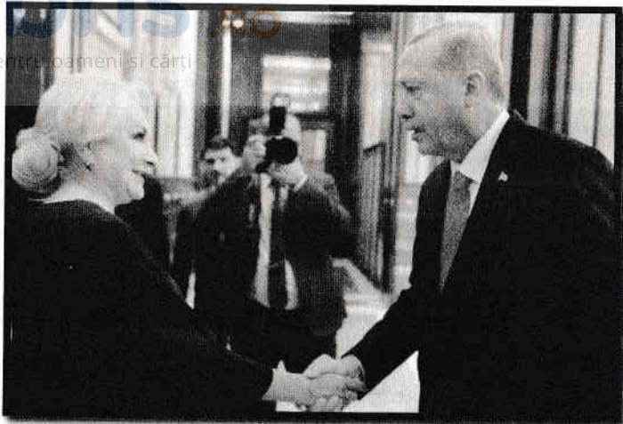
Întrevederea cu președintele turc, Recep Tayyip Erdogan, Ankara 2018