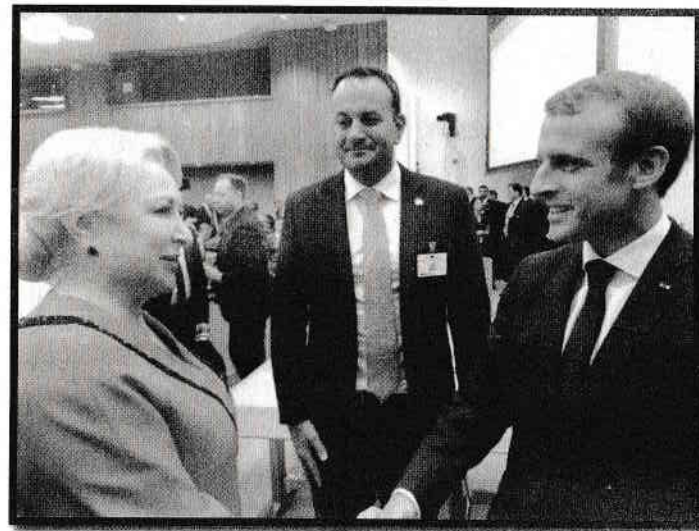
Cu președintele Franței, Emanuel Macron, SUA 2019 Participarea la slujba oficială de Sanctitatea Sa Papa Francisc, Iași, 2019