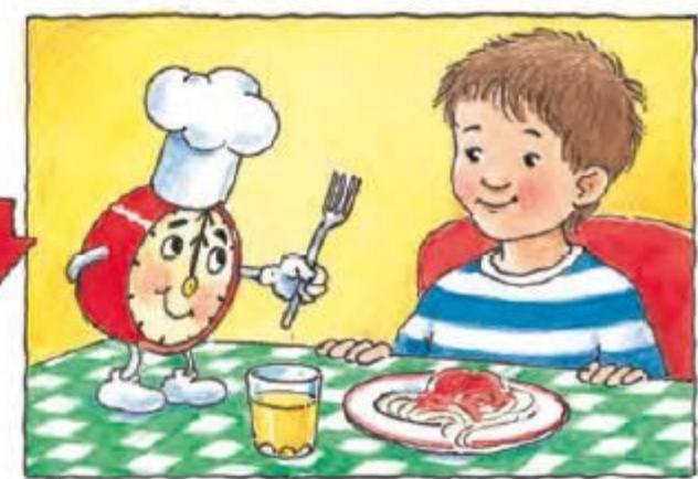
Acum e vremea să iei prânzul. Fără mine ți-ai aminti asta îndestul?