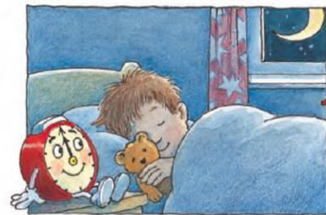
Ai închis ochii după cana de lapte, cine merge și veghează întreaga noapte?

Cine îți arată ora exactă? E clar – cel care te deșteaptă! Încrede-te doar în mine, știu eu vremea când vine!