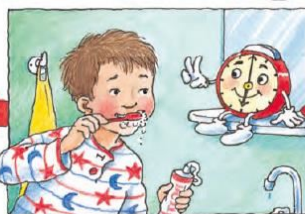
Și la baie îți pot fi de folos. Trei minute îți speli dinții și-n sus și-n jos!