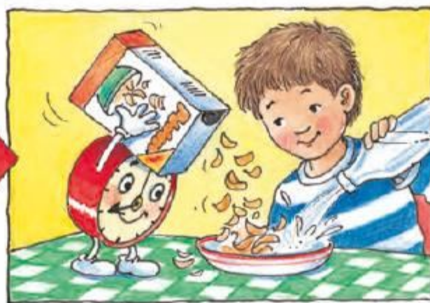
Cine îți planifică și organizează timpul, amintindu-ți: a sosit momentul?