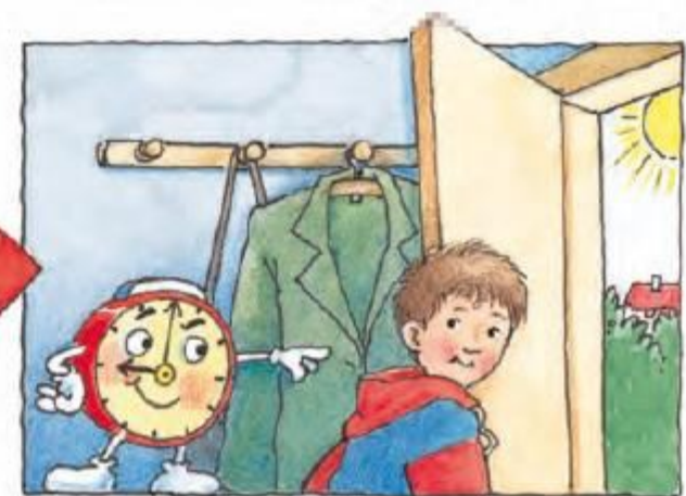
Cine te trimite punctual la drum? Grăbește-te, mai repede, să nu întârzi!