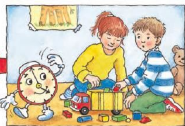
Cine spune: îmi pare rău, nespuse timpul de joacă acum s-a scurs!