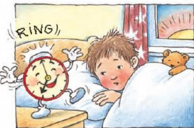
Cine este aproape în fiecare zi atât de amabil încât te scoate dimineața din pat?

Ceasurile și calendarele măsoară timpul, împărțindu-l în perioade mici și mai mari: ani, luni, săptămâni, zile, ore, minute și secunde. Trei dintre aceste perioade se pot citi, de pe cer: ziua, luna și anul.