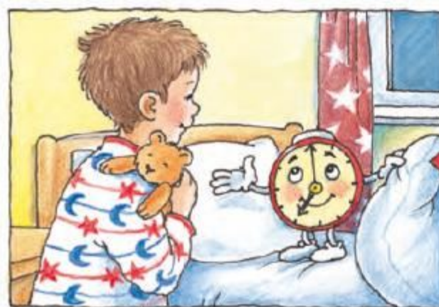
Arunci doar un ochi la mine și-n gând îți apare, acum e chiar vremea să mergi la culcare!