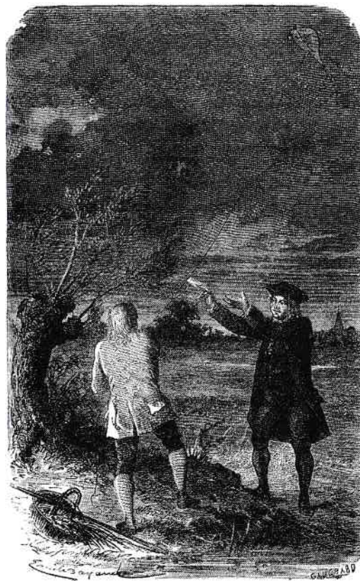
Experimentele științifice ale lui Franklin