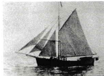
Gjøa, prima corabie care a navigat prin pasajul de nord-vest