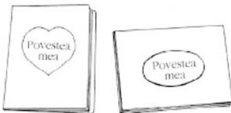
Figura 7.2. Povestea mea