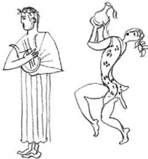
Apolo – clasic, Bacchus – anticlastic, romantic

Cel anticlastic sau dionisiac (de la Dionysos , zeul vinului și al petrecerilor în natură) exprimă atitudinea opusă. Omul este conștient de dimensiunile sale mărunte în raport cu natura, a cărei infinitate în timp și spațiu depășește puterea lui de înțelegere. În creațiile artistice domină formele sinuoase, neregulate ale naturii, care nu pot fi stăpânite de om: valul mării, flacăra focului, creanga care crește. Lumea apare în continuă mișcare, forțele contrare se înfruntă dramatic. În locul rațiunii se manifestă sentimentele. Toate aceste trăsături se întâlneau în înfățișarea tinerilor romantici de la 1830-1850, cu siluete fragile, părul și pelerina fluturând în vânt, apoi în cea a hippy-ilor amintiți mai sus, care în anii 1967-1970 au părăsit orașele pentru a trăi la țară, departe de civilizație, cu flori prinse în plete.