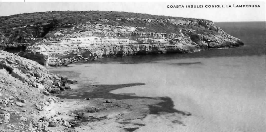
COASTA INSULEI CONIGLI, LA LAMPEDUSA

aridă. Râul cu cel mai însemnat debit de apă este Simeto , care izvorăște din munții Nèbrodi și curge, la început, prin valea care separă Etna de ceilalți munți de la vestul său și apoi prin câmpia catană, pentru a se vărsa, în final, în Marea Ionică. Tot din munții Nèbrodi izvorăște și celălalt râu, care atinge ușor și muntele Etna, de data asta pe versantul de nord, pentru a se vărsa în Marea Ionică, în apropiere de Taormina: Alcântara , denumire arabă care înseamnă „pod”; acesta formează, la câțiva kilometri de mare, chei extraordinare de spectaculoase (vezi pag. 96). Dintre celelalte cursuri de apă, Torto , de pe versantul de nord, și Plātani , de pe versantul de sud, formează un defileu unic, ce împarte insula în două părți separate, două subregiuni, nu numai din punct de vedere geografic, dar și istoric și etnic. Cea mai mare oglindă de apă naturală a insulei este pitorescul lac Pergusa , aflat la 10 km distanță de Enna; apele sale prezintă un foarte rar fenomen de înroșire, datorită prezenței microorganismelor.