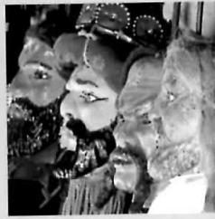
TRADIȚIA: O CULTURĂ UNICĂ, NĂSCUTĂ DIN CONTOPIREA MAI MULȚOR CIVILIZAȚII, CARE SE PERPETUEAZĂ ÎN SĂRBĂTORI, DAR ȘI ÎN VIAȚA COTIDIANĂ