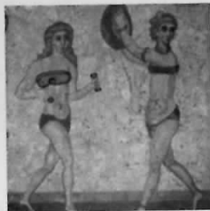
ARTA: PALATE, BISERICI, VILE ȘI MOZAI- CURI, UN PATRI- MONIU COS- MOPOLIT CARE VINE DIN TOATE EPOCILE ȘI AJUNGE PÂNĂ ÎN TIMPURILE NOAS- TRE