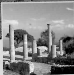
ISTORIA: UN TRECUT FOARTE BOGAT. CARE SE LASĂ DESCOPERIT ÎN SITURILE ARHEO- LOGICE ȘI ÎN MUZEE