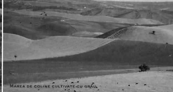
MAREA DE COLINE CULTIVATE-CU GRĂU

Etna este activ din Antichitatea clasică: mitologia greacă îl considera