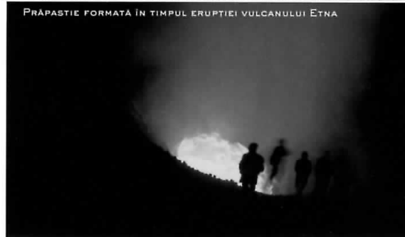
PRĂPASTIE FORMATĂ ÎN TIMPUL ERUPȚIEI VULCANULUI ETNA

reședința zeului Hefaiistos (Vulcan la romani). Erupția cea mai memorabilă a avut loc în 1669, a durat patru luni în cap și a provocat un fluviu de lavă care a ajuns în Catania, revărsându-se apoi în mare. Tot în activitate este și vulcanul Stròmboli, în vreme ce Vulcano, care se află în prezent în faza liniștită, este considerat extrem de periculos, deoarece ar putea reintra în activitate fără să transmită avertismente cu mult timp înainte.