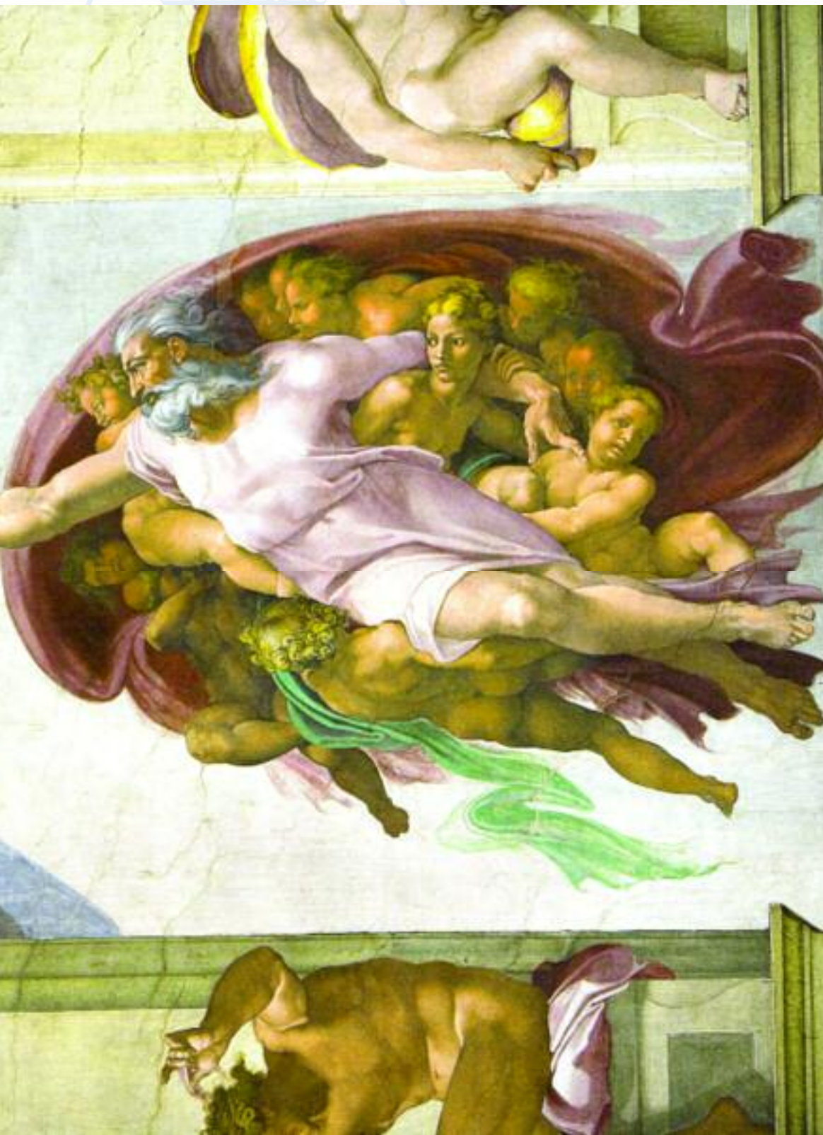
Întruchiparea legăturii dintre uman și divin în momentul creației. Michelangelo, Crearea lui Adam , 1508-1512; tavanul Capelei Sixtine, Vatican.