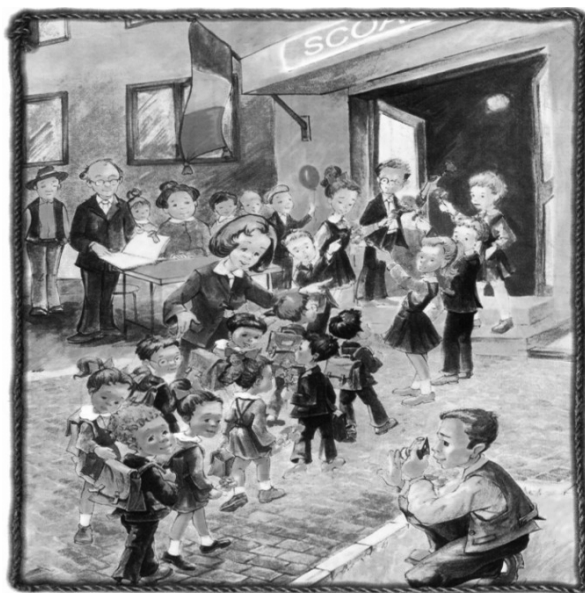
Prima zi de școală

Puțini sunt cei care să nu-și amintească cu drag de prima zi de școală, una dintre cele mai importante zi din viața unui copil. Micuți, frumoși, gătiți și emoționați până la fâstăcire, copiii năvălesc în jurul învățătorului, privindu-l curios și zâmbindu-i știrb. Apoi, începe festivitatea de deschidere a anului școlar, când copiii stau cuminiți lângă părinți și privesc emoționați. Urmează familiarizarea copiilor cu clasa, cu așezatul în bănci, cu manualele și rechizitele școlare și... gata! Încep orele: orele de citire și de scriere, de matematică, muzică, desen etc.