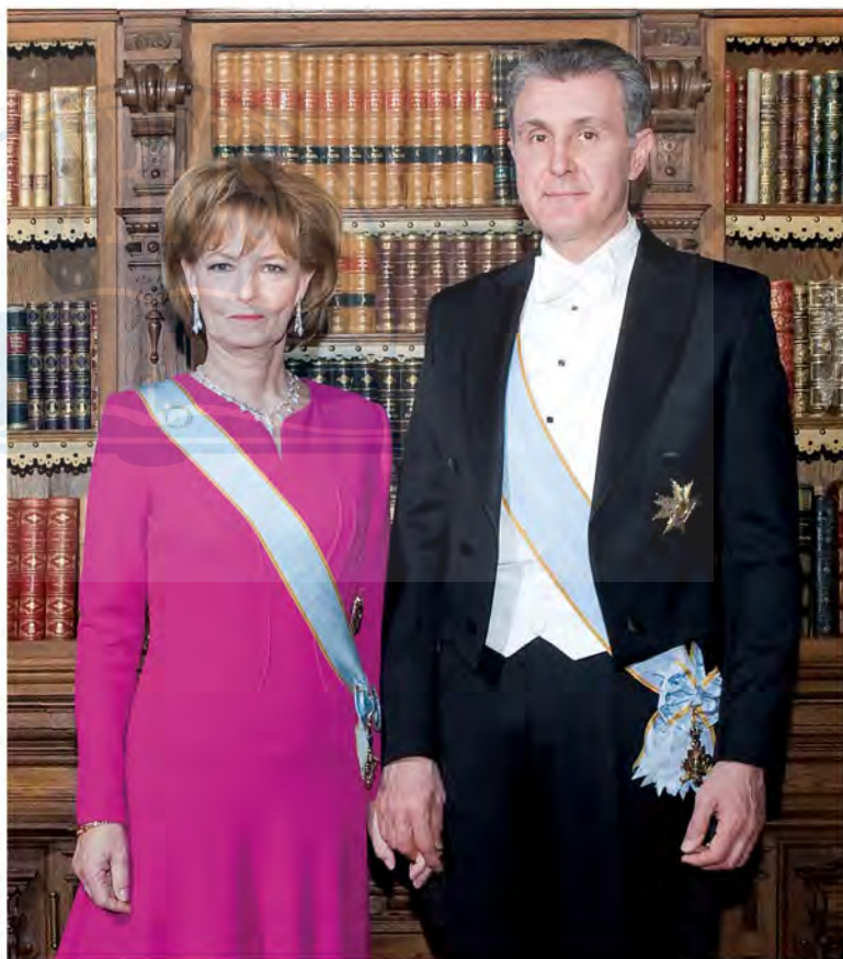
Principesa Moștenitoare și Principele Radu, Castelul Peleş, 25 martie 2015

Un rege modern sau o regină modernă are puține (dacă are) puteri politice, ceea ce este just într-un stat democratic. Marel beneficiu al existenței unui monarh nu este puterea pe care el o exercită, ci puterea care, prin existența lui, nu poate ajunge în mâinile altora. Grație regelui sau reginei, niciun politician, oricât de sus ar fi plasat, nu poate scăpa de sub control. Mereu există cineva, acolo, care se situează deasupra politicii, care se bucură de un respect la care nu poate ajunge niciun alt cetățean.