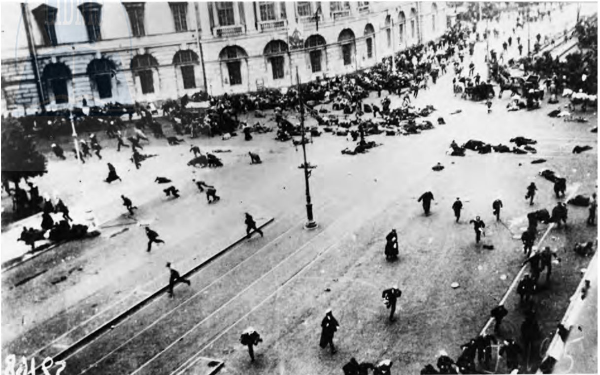
Penuria teribilă de alimente și sărăcia au declanșat demonstrații violente pe străzile Petrogradului (fostul St. Petersburg) în vara anului 1917, iar armata a deschis focul asupra mulțimii pe strada principală Nevski Prospect. Guvernul a pierdut realmente controlul, iar unii soldați au dezertat și s-au alăturat revoluționarilor socialiști.

a atrage țăranimea, care era de departe pătura cea mai largă a populației. A fost o mișcare pe un teren fertil, care a devenit în scurt timp o sursă de neliniște pentru segmente mai sensibile din nobilime și chiar din familia imperială. Nevoia de schimbare era evidentă, și numai țarul, tot mai supus presiunilor de a abdică sau de a fi înlăturat cu forța, nu părea conștient de ea.