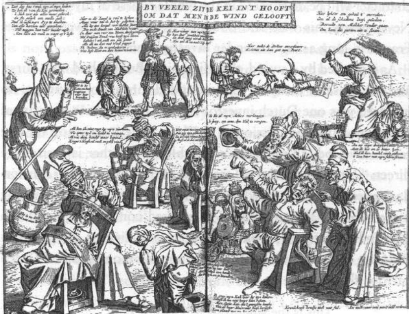
Nebunia investitorilor care au cumpărat acțiuni Mississippi : gravură din Marea scenă a nebuniei (1720)

Au apărut o serie de gravuri alegorice umoristice publicate sub titlul Marea scenă a nebuniei , care înfățișau : agenți de bursă înghițind aur și defecând acțiuni Mississippi ; investitori cu mințile rătăcite alergând năuci prin rue Quincampoix, înainte de a fi adunați și băgați la azilul de nebuni ; ba chiar și pe Law, trecând voios pe lângă niște castele de aer, într-o caleașcă trasă de doi cocoși galici amărâți 70 .