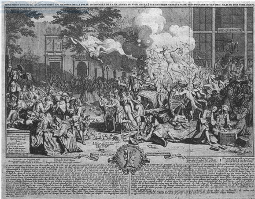
Bernard Picart, Monument închinat posterității (1721)

Magnitudinea catastrofei a fost, poate, cel mai bine surprinsă de Bernard Picart în gravura sa Monument închinat prosperității (1721). În partea stângă, niște investitori olandezi fără nici un sfaț se îndreaptă amărâți spre bolniță, balamuc și azil. Dar scena pariziană din dreapta e și mai apocaliptică. Zeița Fortuna, despuiată, toarnă contracte options și acțiuni Mississippi peste o mulțime ce năvălește din rue Quincampoix, în vreme ce un car uriaș tras de indieni zdrobește un contabil sub o roată a norocului imensă, iar în fundal se vede cum se încaieră doi oameni 71 .