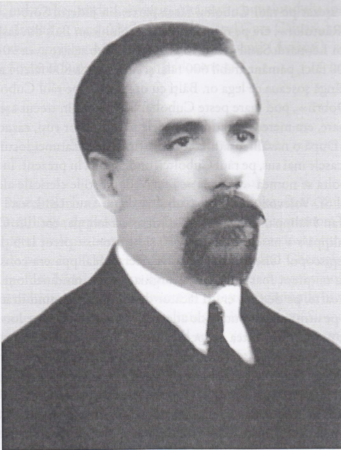
Fig. 1. Pantelimon Halippa (1883–1979).