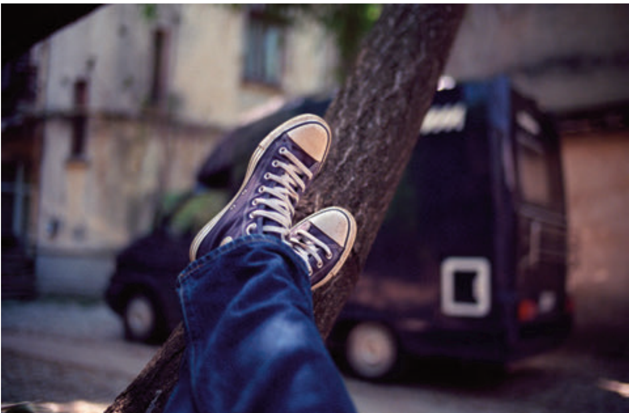
Prima fotografie cu autorulota, București, 2013