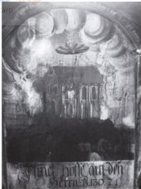
Fig. 2. Pictura murală în Biserica Mănăstirii din Sighișoara.

imagini ale unor OZN-uri. S-a emis opinia că aceste obiecte reprezintă roata carului descris în viziunea lui Iezechiel, atâta doar că în această viziune se vorbește de patru roți, iar aici este doar una singură și fără car.